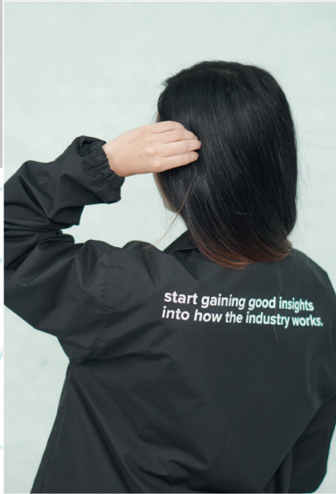
start gaining good insights into how the industry works.