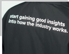
start gaining good insights into how the industry works.